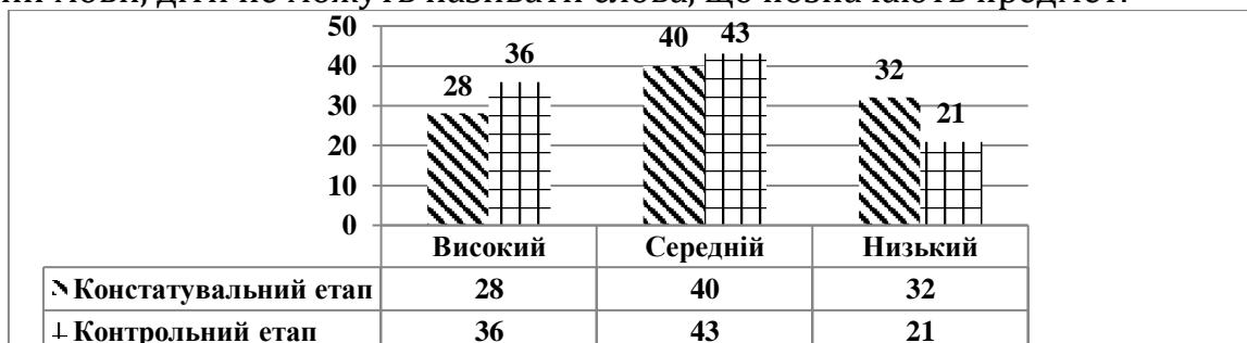
Рис. 1. Динаміка рівнів розвитку мовлення у дітей раннього віку (контрольний та констатувальний етапи, %)

На нашу думку, такий стан розвитку словника та мовлення в дітей раннього віку обумовлений несистематичним відвідуванням закладу дошкільної освіти, не включення дітей в освітній процес, відсутність належного уваги батьків проблемі розвитку словника та мовлення дітей у домашніх умовах. Також у дітей із низьким рівнем розвитку словника відзначені труднощі у вживанні всіх частин мови, діти не можуть називати слова, що позначають предмет.