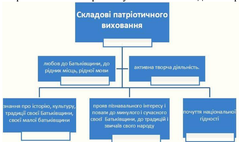
Рис.1. Складові патріотичного виховання

На рис.1. можемо переглянути основні складові патріотичного виховання.